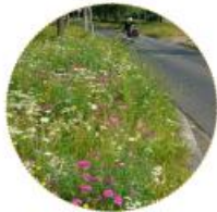
BLOEM EN KRUIDENRIJKE BERMEN